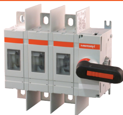
M200U30 avec poignée directe HD250