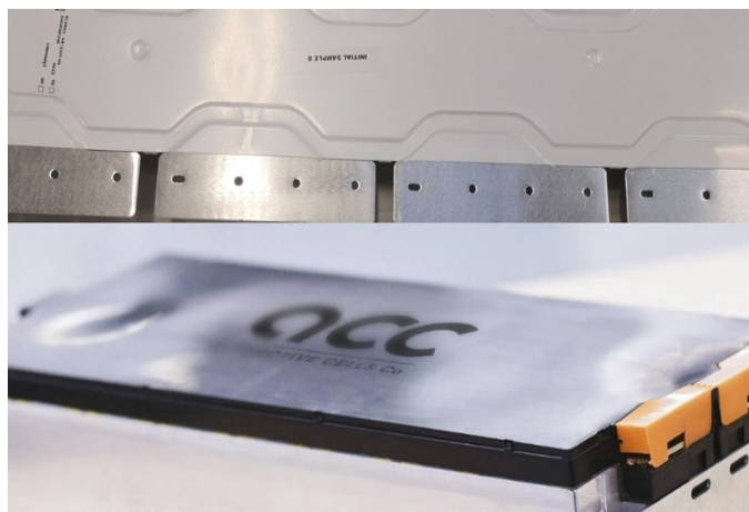
Busbar intelligent pour module ACC