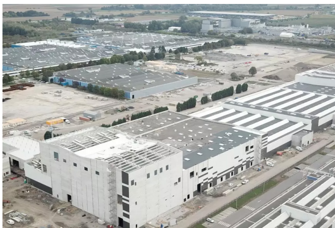
Site de la future gigafactory de Douvrin (France)